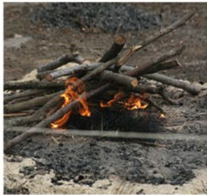
LA PRESENCE HUMAINE EN CORSE AU PALEOLITHIQUE

Le Parc Galea est le siège de l'INEACEM (Institut d'études appliquées des civilisations et espaces méditerranéens) qui est en relation étroite avec des partenaires internationaux (chercheurs, universités, musées...), pour organiser tout au long de l'année des colloques en direction des professionnels et du grand public. Les résultats de ces sessions d'études sont immédiatement traduits en conférence, en exposition temporaire ou intégrés aux espaces scénographiques permanents du parc. Au chapitre des recherches actuelles, trois thèmes majeurs sont privilégiés :