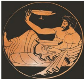
LA PLACE DE NOTRE ILE DANS L'ENVIRONNEMENT ETRUSQUE