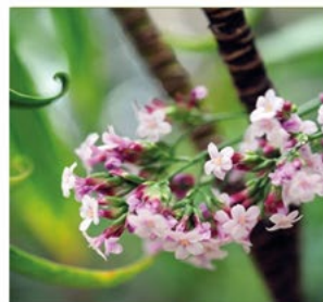
LA QUESTION D'UNE INTELLIGENCE VEGETALE